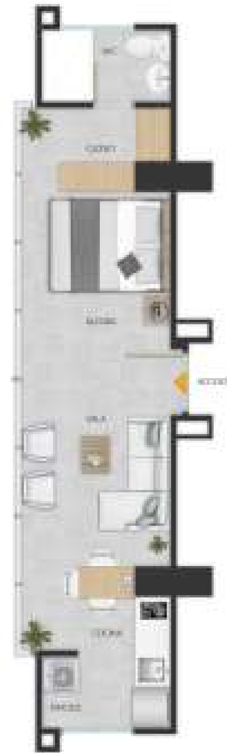
APTO. TIPO 3