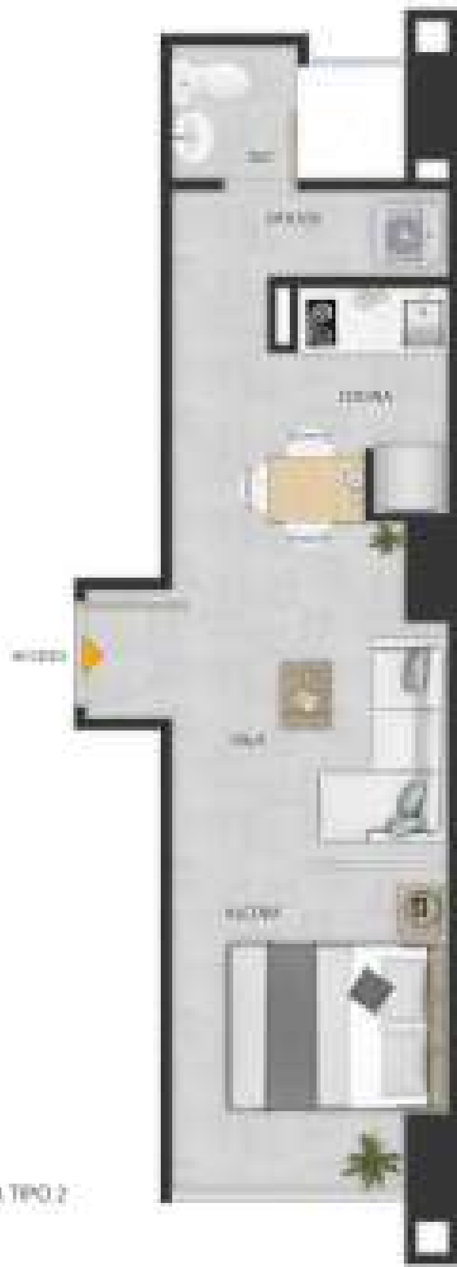
APTO. TIPO 2