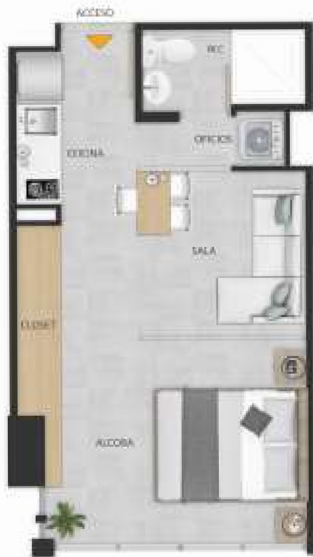
APTO. TIPO 1